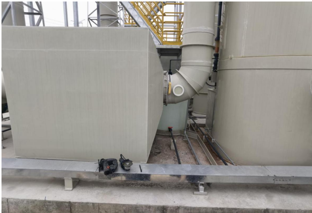
施工取电使用的排插位置