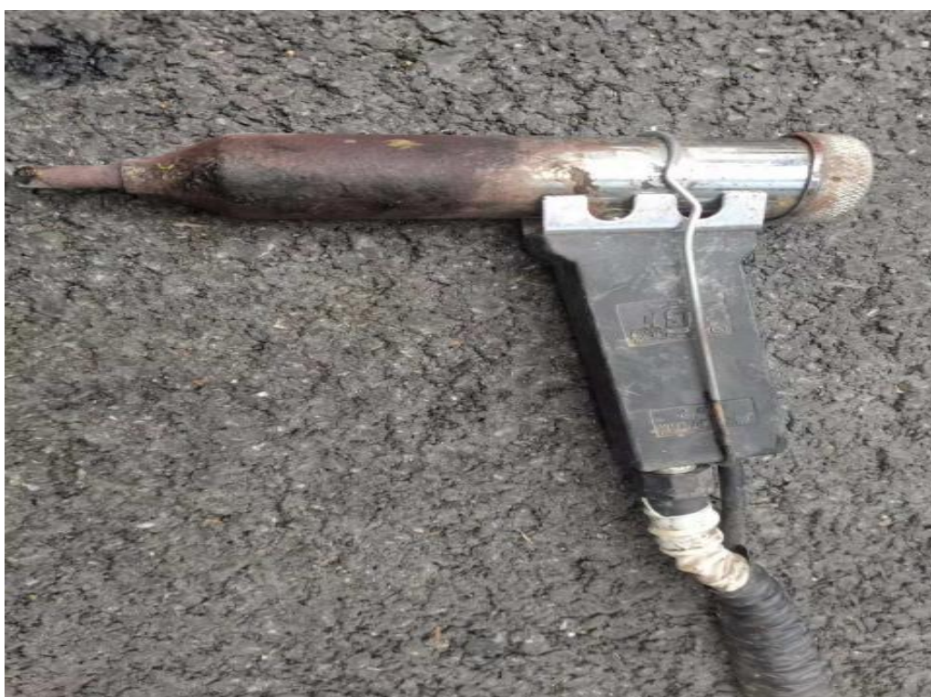
塑料焊枪枪头（铁丝临时固定）