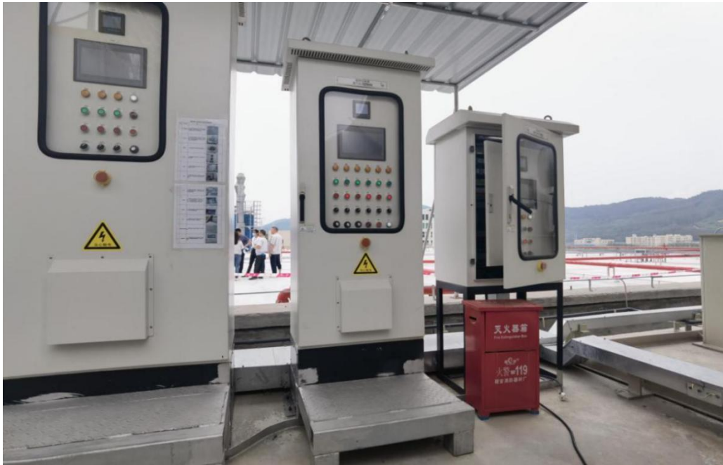
施工取电使用的 LCD 熔射废气处理控制柜（右一）